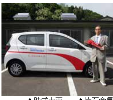
▲助成車両 ▲片石会長

このたび、北海道共同募金会より「全道広域共同募金助成」を受けて、赤い羽根共同募金車両一台（ダイハツ ミライース）を整備しました。本車両の整備により、法人事業やサロン事業、ボラセン事業など、より充実した地域福祉活動推進のための事業を実施してまいります。赤い羽根共同募金にご協力いただきました皆様、心よりお礼申し上げますとともに、大切に赤い羽根車両を使わせていただきます。ありがとうございました。