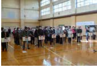
【老人クラブ会員の皆様】