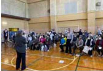
【競技の様子：最初はグー】