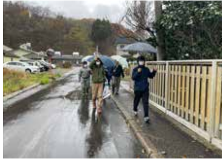
【避難所の豊川会館までの移動体験】