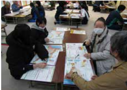
【避難行動計画の作成の様子】