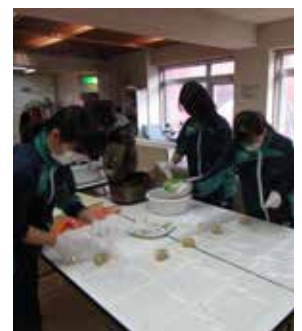
【炊き出し訓練の様子：かあちゃん食堂たまりば・江差町食生活改善推進協議会・江差町赤十字奉仕団・江差高校ボランティア同好会 協力】