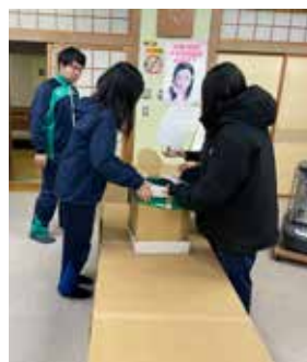
【段ボールトイレ完成】