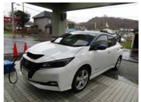
【電力供給 (EV 車)：檜山振興局協力】