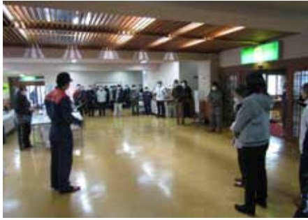
【江差消防隊員による避難訓練の説明】