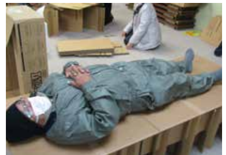
【段ボールベッド完成】