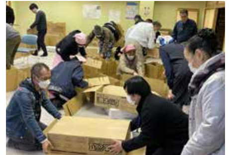
【段ボールベッド組立て中】