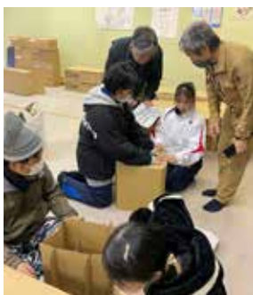
【段ボールトイレ組立て中】