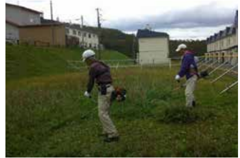
【草刈り作業の様子】

江差町高齢者事業団(新栄町 264-2 老人福祉センター内) 電話 52-5020