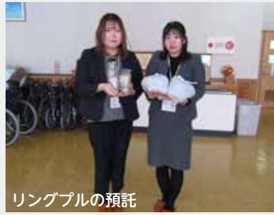
リングプルの預託 【明治安田生命江差出張所 様】

生命保険会社様より地域に対する社会貢献の一環として、社内で呼びかけ集められた沢山のリングプル・使用済み切手を預託いただきました。この預託品は、地域福祉推進のために大切に活用させていただきます。