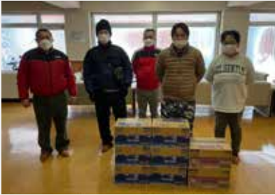
【(左) コカ・コーラボトリング 函館営業所職員 様】

同社は、社会貢献活動の一環として市町村の福祉施設の子供達や高齢者などの皆様に昭和43年からクリスマスプレゼントとして贈り続けられ今年で56回目となりました。