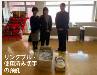
リングプル・使用済み切手の預託