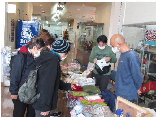
〔江差町役場町民ギャラリーでの出店の模様〕