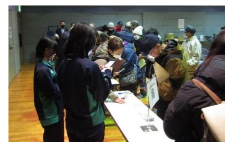
〔ボランティア受付の様子〕

ボランティア受付（管理システムキントーンを活用しQRコードをスマホで読み込み）～仮想の活動依頼（被災ニーズ）3件（土砂撤去1カ所・被災木撤去2カ所）の説明とマッチング～資機材の貸出と活動への送り出し～活動後の報告