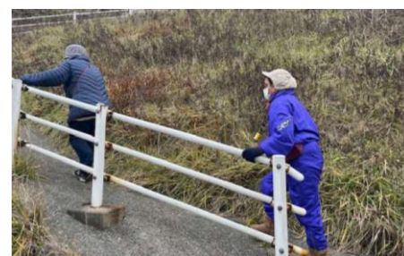
〔海岸町住民の避難訓練の様子〕