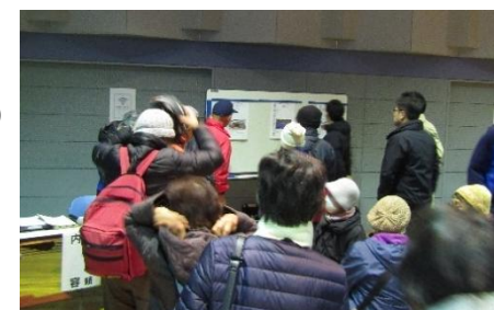
〔被災ニーズ説明の様子〕

かあちゃん食堂たまりば（コミュニティプラザえさし エコー） 江差町食生活改善推進協議会（江差町保健センター） 江差高校ボランティア局生徒の皆さん