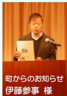
町からのお知らせ 伊藤参事 様